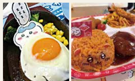
推しコラボメニュー

休日は、アニメ鑑賞・カラオケ・映画鑑賞・ジム・友人とランチなど楽しんでいます。特にカラオケは大好きで3時間ノンストップで歌うこともあります。ストレス発散にもなり、気分爽快です！アニメは幅広いジャンルを観ており、1日中楽しんでいる日もあります。「転生したら魔法学校の生徒になりたい！！」と本気で思うくらいファンタジー作品が好きです（笑）