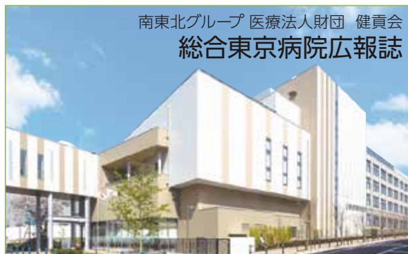
南東北グループ 医療法人財団 健貢会 総合東京病院広報誌

医療連携支援センター 地域連携室 TEL:03-3387-5444 編集・発行/総合東京病院 印刷/石井電算印刷株式会社