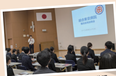
施設・グループについての説明