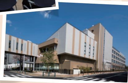
総合東京病院 外観