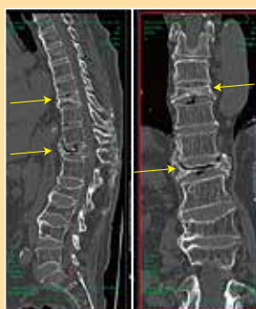
圧迫骨折が起こっている椎体

ある場合、無理に我慢したり、まだ大丈夫と思って腰に負担のかかることをしたりしていると急激に悪化し、治療期間が長くなる、またはリハビリテーションをしてもなかなか元には戻らないといった結果になることがありますので、本当に悪くなる前に、当科外来を受診してください。