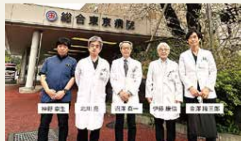
脊椎脊髄センタースタッフ一同