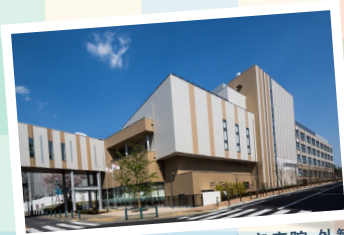
総合東京病院 外観