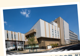
総合東京病院 外観