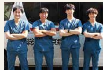
救急救命士が4名おり、 充実した救急体制を整えています。

当院救急救命士は現在4名在籍しており、業務内容としては救急外来での患者対応、病院救急車を使用した転院搬送業務、BLS講習での講師を行っています。