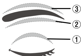
図2 皮膚を切除する部位

軽度の皮膚弛緩だけのものは皮膚を切り取るだけの手術となりますが、切り取る場所は①睫毛の上の二重の線②眉毛の下③眉毛の上の3箇所があり（図2）、その症状と患者さんの希望を取