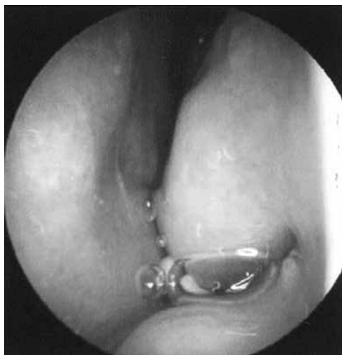
花粉症発作期の鼻腔 鼻汁が多く粘膜が腫れている

これらの治療をカバーし、体質改善を目指す治療として「漢方治療」が注目されています。